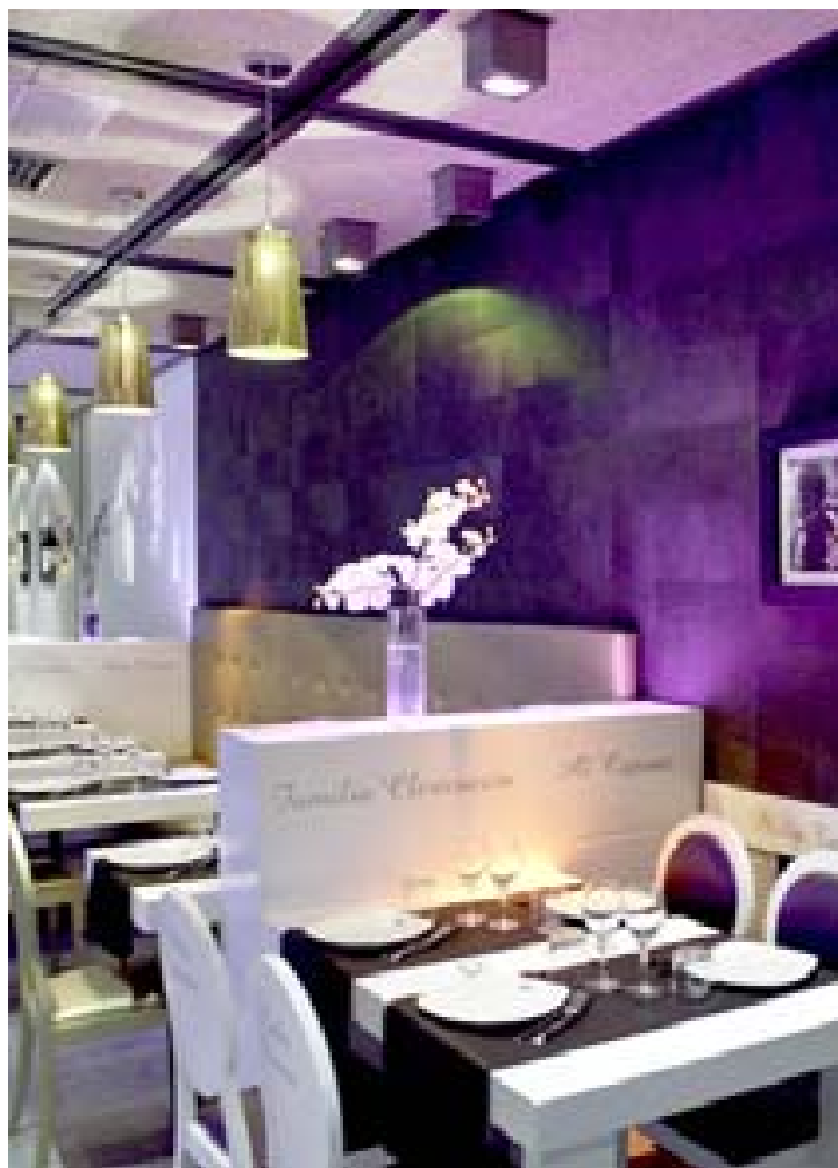
Restaurante de La Mafia se sienta a la mesa en Zaragoza. eE

Las perspectivas de La Mafia se sienta a la mesa para este año se sitúan sobre la favorable evolución que ha tenido en los últimos cinco años como consecuencia del cam-