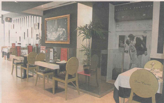
El local de La Mafia se sienta a la mesa ubicado en la calle Casa Jiménez, 6, de Zaragoza.

Pero como apuntábamos, es la carta la que lleva el peso gastronómico. Y sobre todo, las múltiples combinaciones que se pueden crear a partir de los 17 tipos de pasta y las 17 salsas, a mezclar a gusto del consumidor. En cuanto a las pastas, cuatro son de grano duro, seis frescas (con un suplemento de 0,60 euros) y siete rellenas (+1,20 euros). Así, el clien-