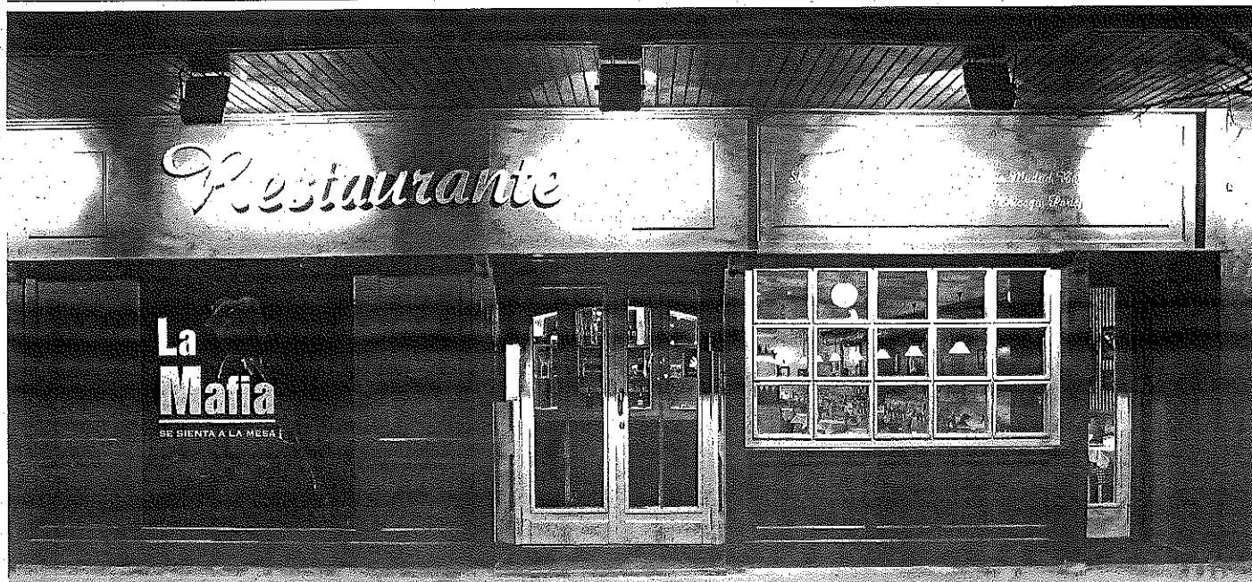
La Mafia se Sienta a la Mesa. Restaurante temático